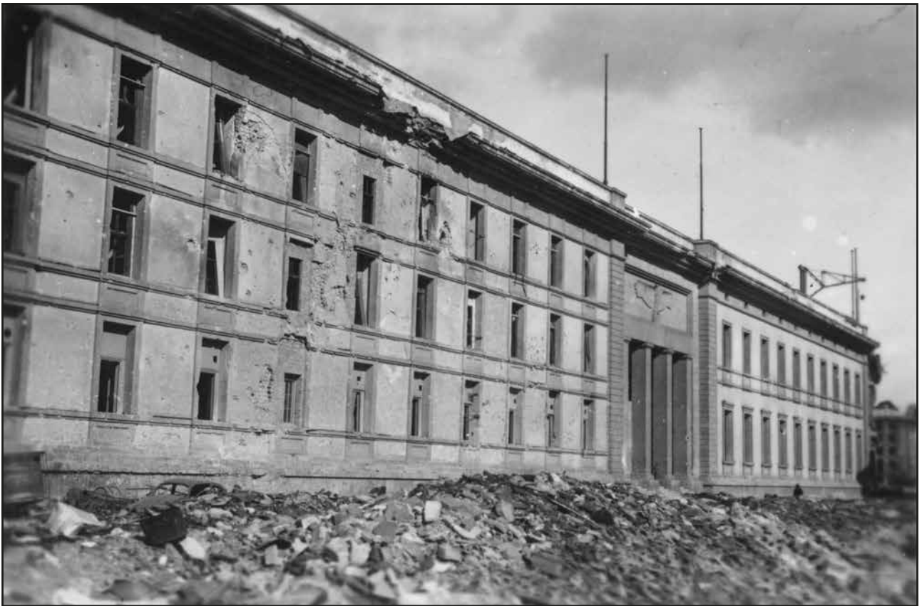
Abb. 131 Auf diesem Foto sieht man die teils vermauerten Schäden an den Fensteröffnungen (1945)