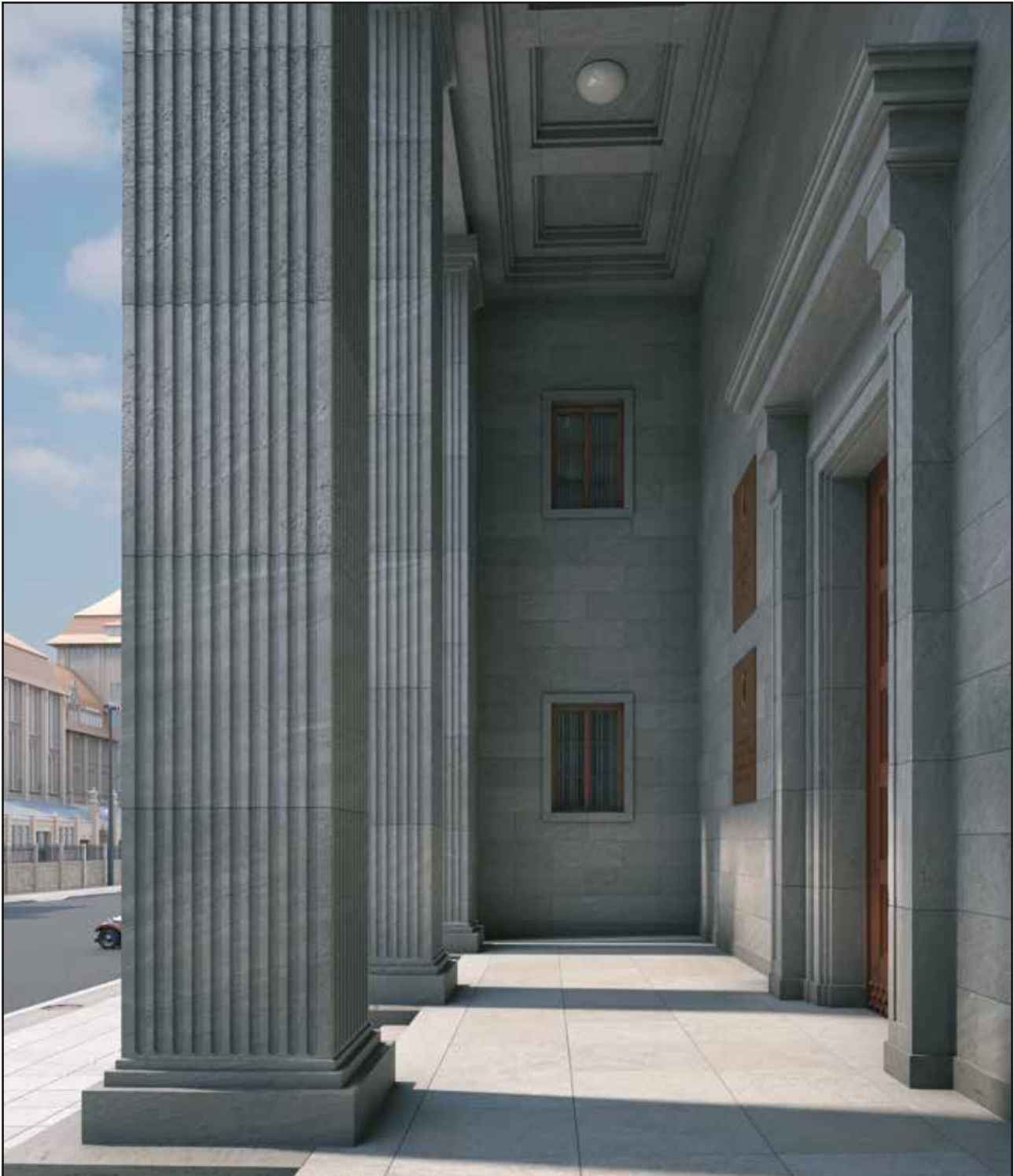
Abb. 95 Blick auf die westliche Schmalseite der Vorhalle des Portals

Albert Speer konnte also, bedingt durch die unterschiedlichen Raum- und Etagenhöhen in beiden Flügeln der Präsidialkanzlei, im Portal keine Symmetrie zwischen den Seitenfenstern herstellen.