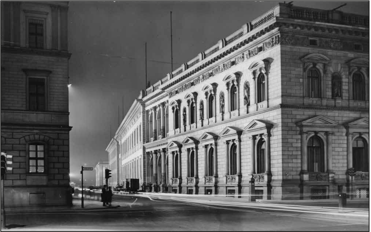
Abb. 122 Blick vom Wilhelmplatz in die Voßstraße bei Nacht (1939)