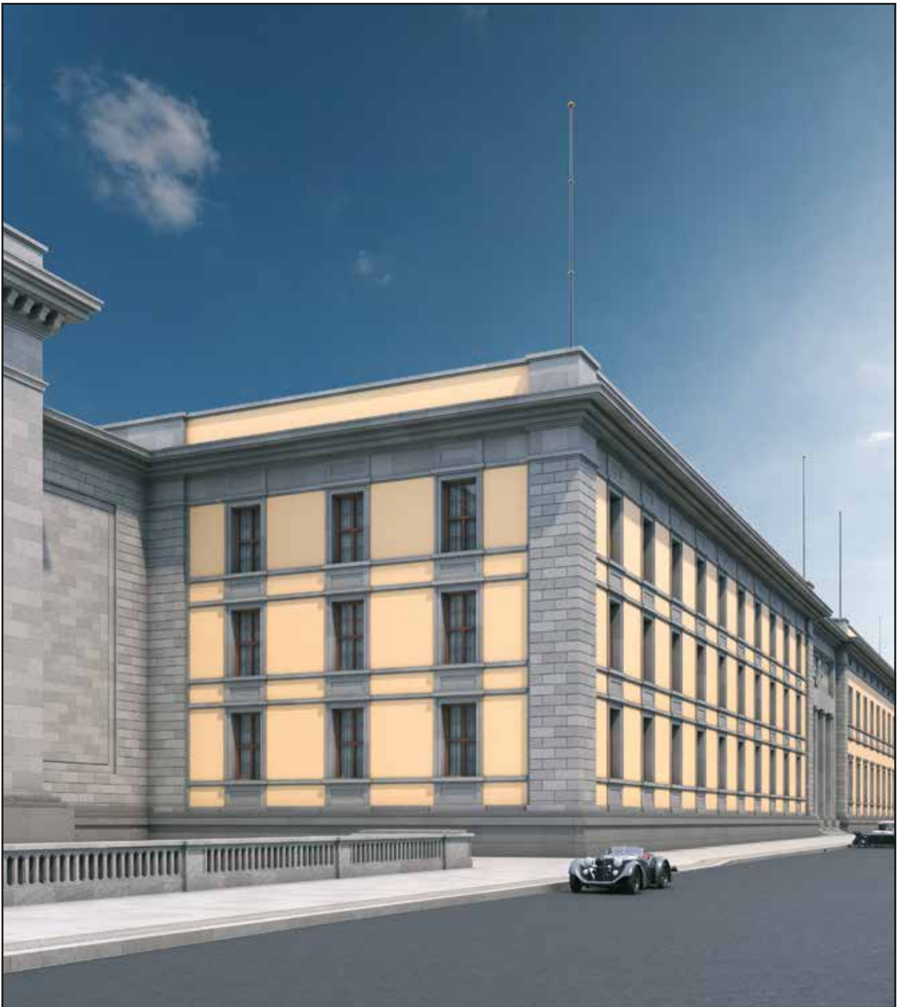
Abb. 82 Blick auf die dreiachsige Westfassade der Präsidialkanzlei

Weiterhin erreichte Speer eine bessere Harmonie zwischen den beiden unterschiedlichen Fassadenteilen, indem er das Gesamtbild des Baukörpers durch wiederkehrende Formen und Materialien zu einer Einheit formte. Auf der Grundlage der Gestaltungselemente der Ostfassade entwickelte Speer ein netzförmiges Gerüst aus Bändern und Spiegelflächen. Dafür führte er den Bereich zwischen den Fenstern als