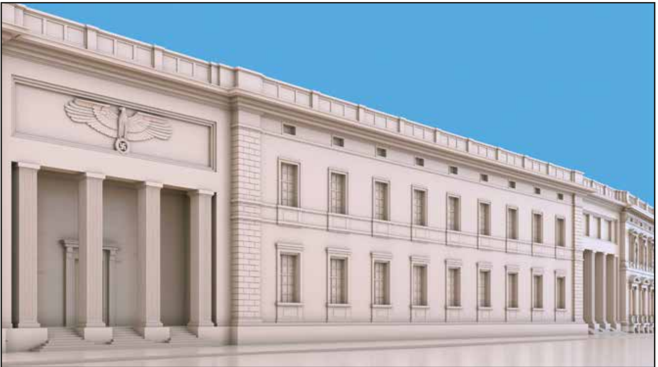
Abb. 23 Der Entwurf 1B vom Portal der Präsidiakanzlei aus betrachtet