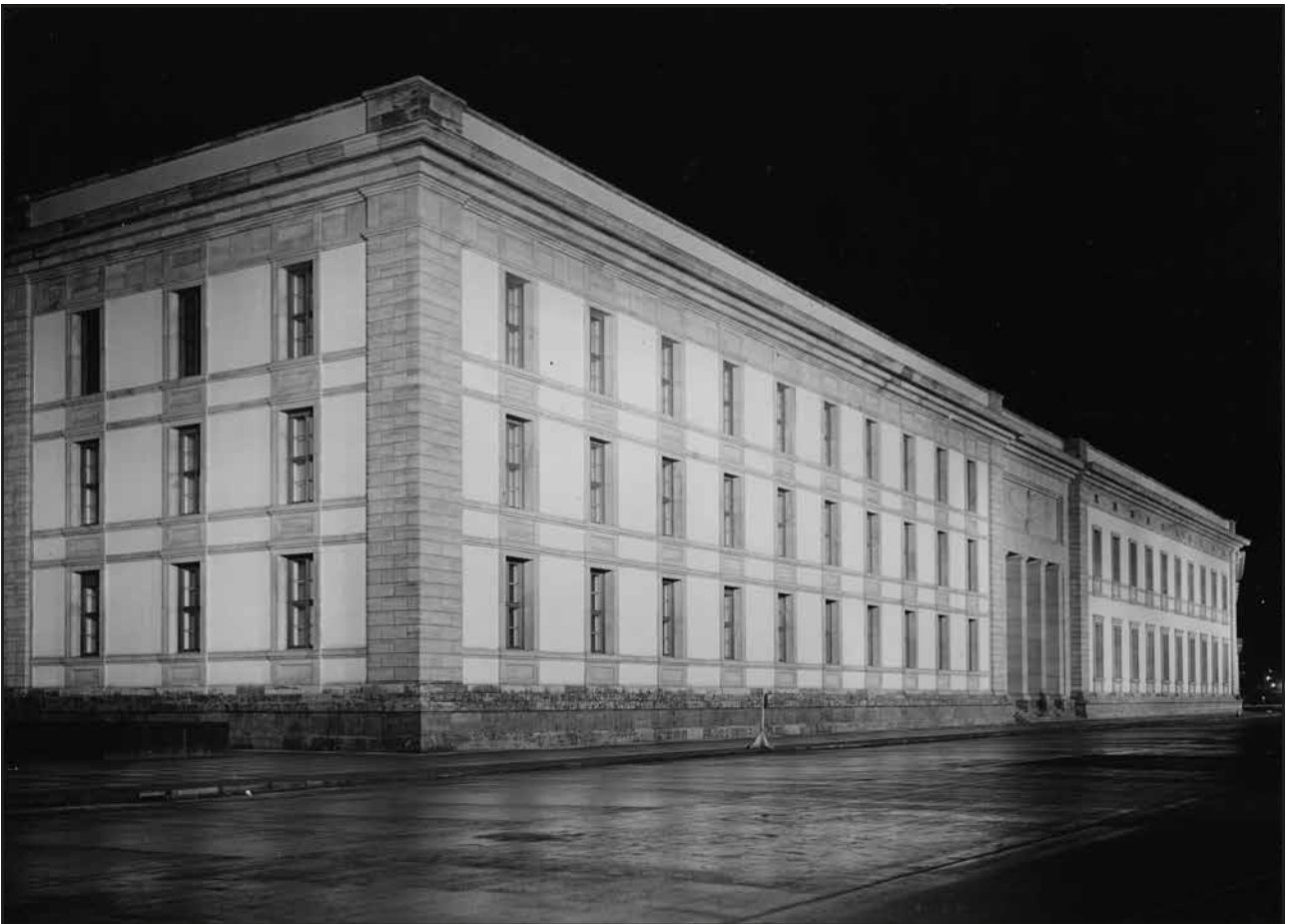
Abb. 123 Die Präsidialkanzlei im Schein des Kunstlichts kurz nach ihrer Fertigstellung (1939)