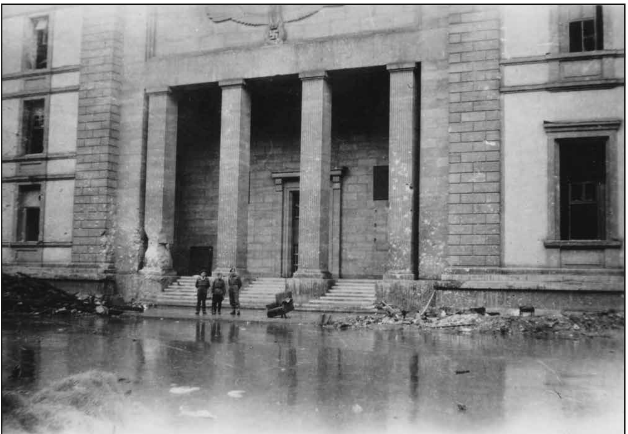
Abb. 132 Das durch Artillerietreffer beschädigte Portal der Präsidialkanzlei (1945)