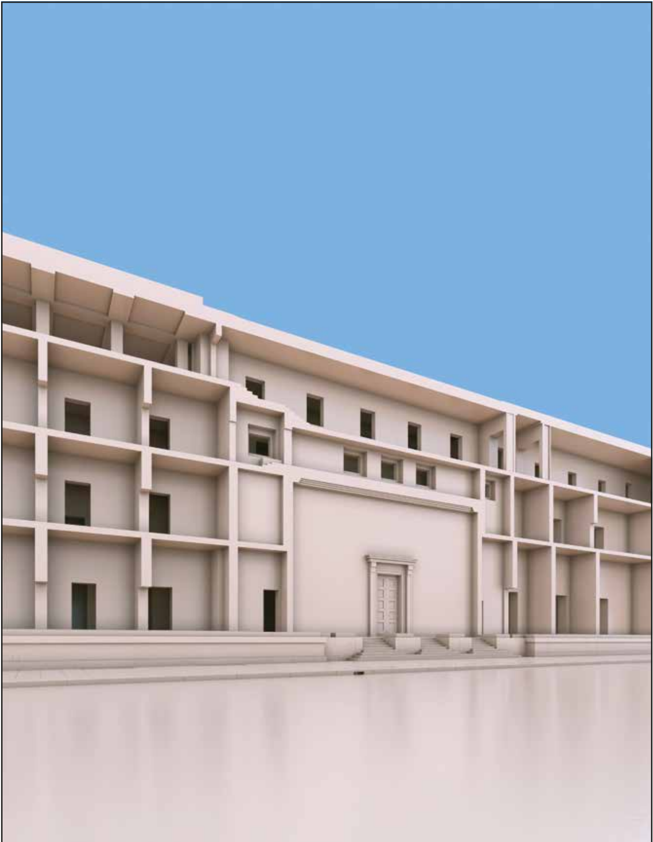
Abb. 59 Schnitt durch die an der Voßstraße liegenden Flure und Räume der Präsidialkanzlei

beide Gebäudeflügel hindurch. Dies kam daher, dass die Raumhöhen und die Etagenanzahl des Ostflügels nicht auf die des Westflügels abgestimmt waren.