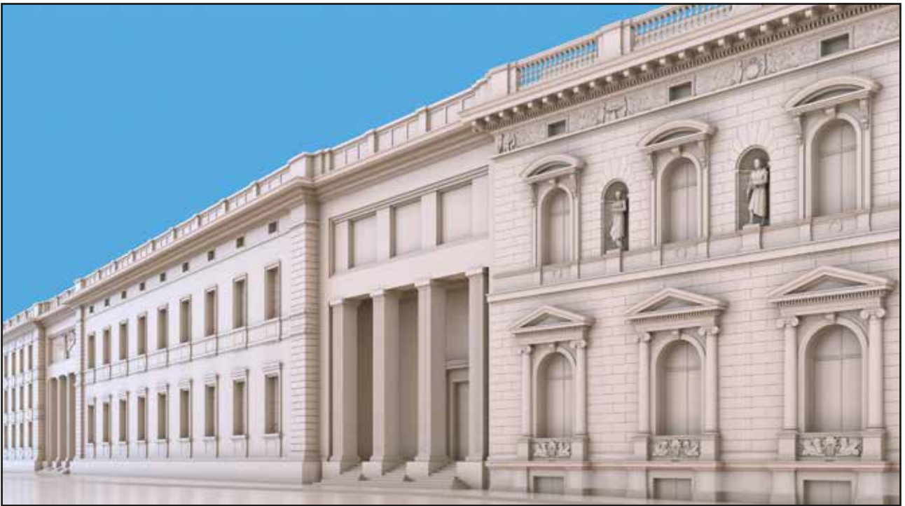
Abb. 22 Der Entwurf 1B vom Portal des Borsig-Palais aus betrachtet